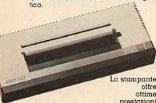
La stampante offre ottime prestazioni

Prima di passare alla descrizione delle periferiche dobbiamo sottolineare l'estrema potenza della grafica e del generatore sonoro di questo modello, che permettono la gestione di ben 16 modi video, a partire da 24 x 40 pixel in quello testo, fino a 192 x 320 pixel in grafica.